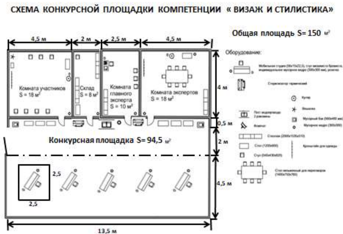
Схема конкурсной площадки на 8 рабочих мест (см. иллюстрацию)

Схема конкурсной площадки на 5 рабочих мест (см. иллюстрацию)