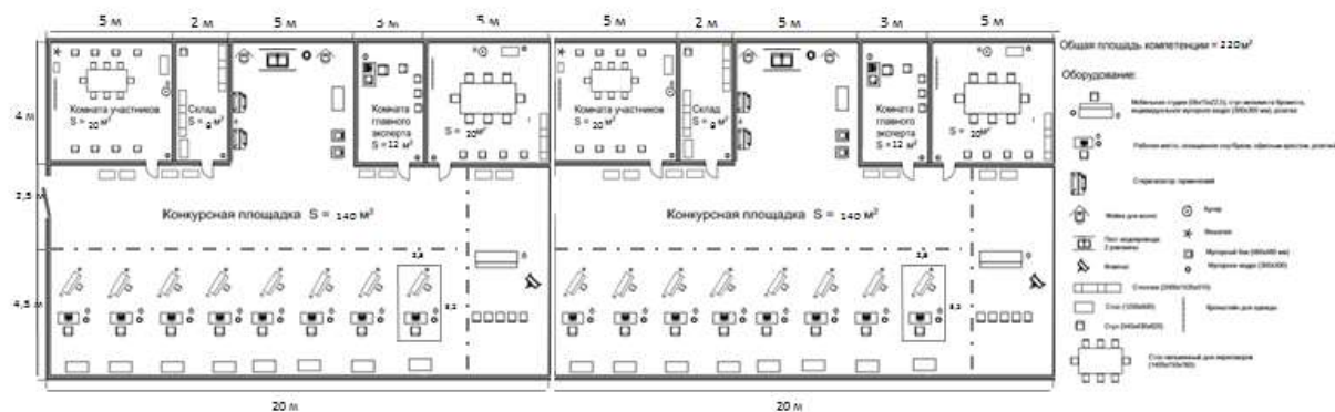
СХЕМА КОНКУРСНОЙ ПЛОЩАДКИ КОМПЕТЕНЦИИ «ВИЗАЖ И СТИЛИСТИКА»

Конкурсная площадка должна выглядеть эстетично и привлекать внимание посетителей, VIP-гостей и журналистов: